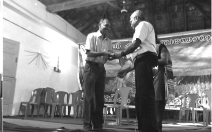
20. Prize distribution - Glib talk contest