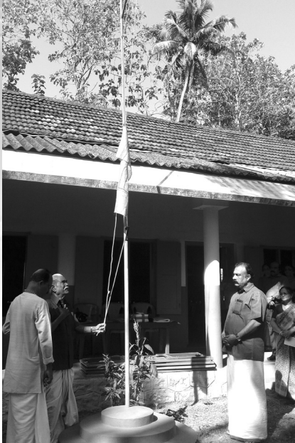
1. Flag Hoisting