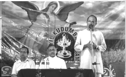
8. Presidential Addresses