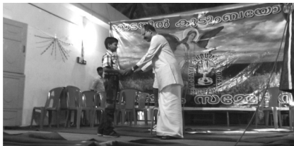
21. Prize distribution - games