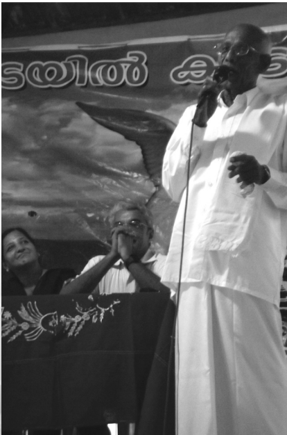
14. Glib talk contest