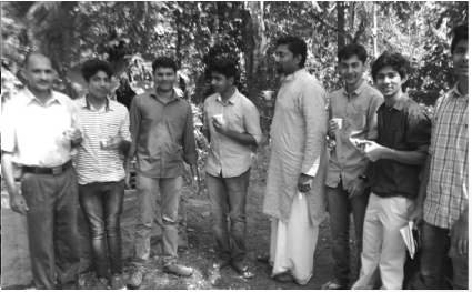
6. Tea Break