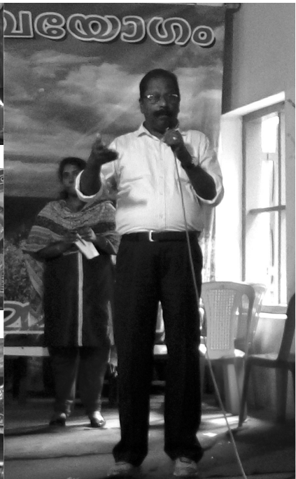
24. Vote of Thanks