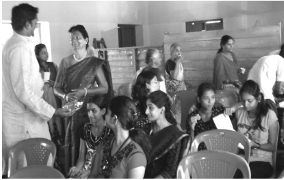
5. Tea Break