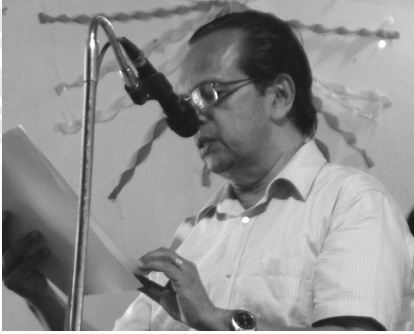
9. Annual Report