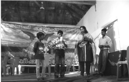
19. Cup shuffling contest