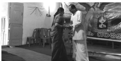
23. Prize distribution - games