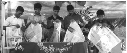
15. Paper tearing contest