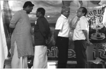
17. Balloon bursting contest