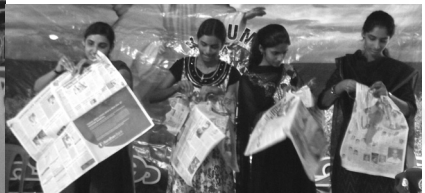
16. Paper tearing contest