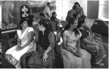
18. Musical chain