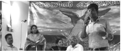
13. Glib talk contest