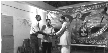
22. Prize distribution - games